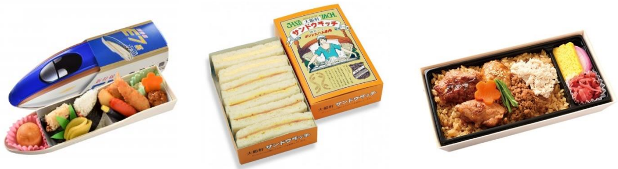
図2：販売駅弁（左から新幹線E7系弁当、大船軒サンドウイッチ、鶏めし弁当）